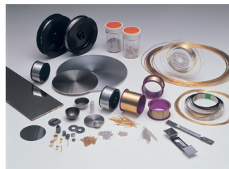
松田産業の多彩な貴金属製品

松田産業は、技術へのこだわりと長期的視点を持って築き上げられてきた。価値あるものは決して無駄にせず、大切に育てたものは、長い将来にわたって持続的な力になる。——創業以来、その思想を体現してきた。1935年以来、同社は「有限資源は大切に、有効に使われるべきである。企業は利益だけでなく社会への貢献を通じて価値を創造すべきだ」というシンプルな考え方を受け継いできた。長い年月をかけて、この倫理観は貴金属と食品という二つの異なる業界が密接に関連する分野で形を成し、ほか