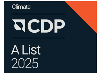
Được vinh danh trong “CDP A List” hai năm liên tiếp ở hạng mục Biến đổi Khí hậu