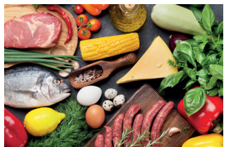
Hình minh họa các nguyên liệu thực phẩm của Matsuda Sangyo

Mảng kim loại quý vẫn là trung tâm của câu chuyện. Matsuda Sangyo định vị hoạt động này không đơn thuần là tái chế mà là một nền tảng tuần hoàn tài nguyên toàn diện bao gồm thu hồi, tinh luyện, phân tích, sản phẩm hóa chất, sản phẩm gia công và các giải pháp vòng kín. Công ty không chỉ xử lý chất thải ở cuối chu trình sản xuất. Họ hoạt động xuyên suốt chuỗi giá trị, hỗ trợ khách hàng thu hồi kim loại quý từ chất thải phát sinh trong quá trình sản xuất của các nhà sản xuất thiết bị điện tử và đưa chúng trở lại sử dụng công nghiệp dưới những hình thức đáp ứng các tiêu chuẩn khắt khe.