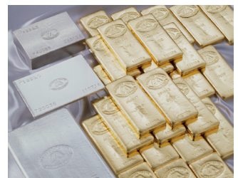
Thỏi kim loại quý của Matsuda Sangyo