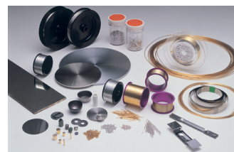
Dòng sản phẩm kim loại quý của Matsuda Sangyo

Matsuda Sangyo Co., Ltd. được xây dựng bằng bản năng của một người thợ thủ công và sự kiên nhẫn của một người làm vườn: không điều gì có giá trị nên bị lãng phí, và những gì được chăm chút cẩn thận có thể tạo nên sức mạnh cho nhiều thế hệ. Kể từ năm 1935, công ty Nhật Bản này đã theo đuổi một ý tưởng đơn giản: tài nguyên hữu hạn phải được sử dụng một cách khôn ngoan và kinh doanh không chỉ tạo ra giá trị thông qua lợi nhuận mà còn thông qua đóng góp cho xã hội. Qua nhiều thập kỷ, đạo lý đó đã hình thành trong hai lĩnh vực riêng biệt nhưng có liên hệ chặt chẽ kim loại quý và thực phẩm nơi Matsuda Sangyo liên tục cho thấy khả năng phục hồi giá trị, khôi phục tính hữu dụng và xây dựng khả năng chống chịu ở những nơi người khác chỉ nhìn thấy giới hạn.